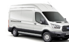
BLANCO OXFORD - 3GZ